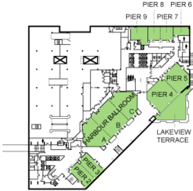
HOTEL CONVENTION LEVEL- 3 e étage Harbour Ballroom, Foyer “Pier”