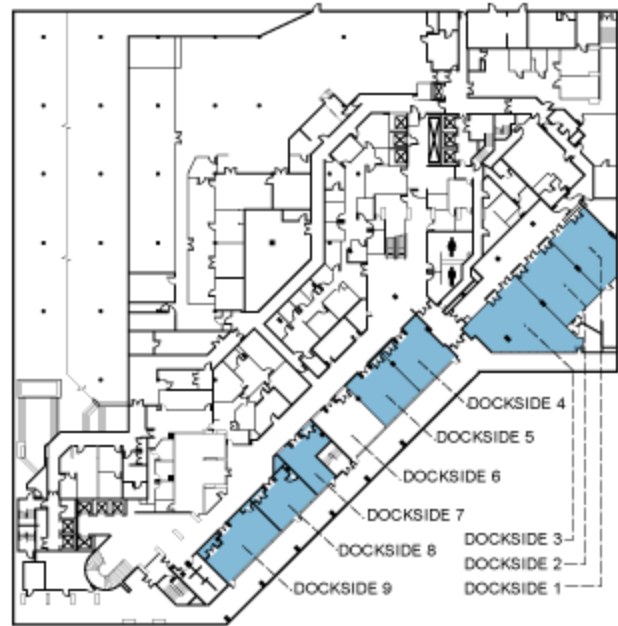
LOWER LEVEL “Dockside”

L'Académie canadienne de psychiatrie de l'enfant et de l'adolescent tient à remercier les commanditaires du Congrès 2010: